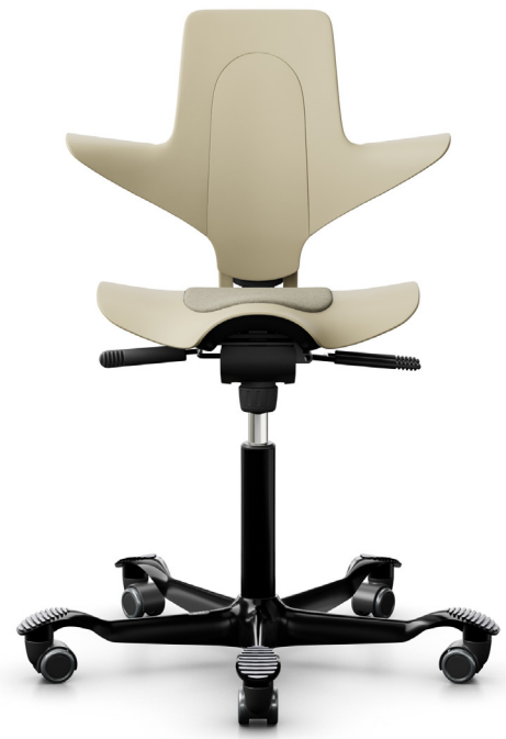
Design: Peter Opsvik. Patent- und Designgeschützt.